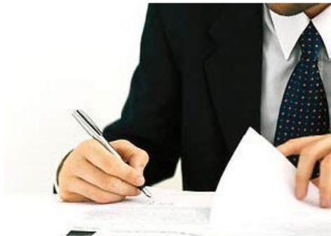
Gerichtsvollzieher muss Eintragungsanordnung ins Schuldnerverzeichnis unterschreiben

Bei der Eintragung des Schuldners in das Schuldnerverzeichnis - immerhin ein folgenschwerer Schritt - muss alles seine rechtliche Ordnung haben. Eine eingescannte und in die Eintragungsanordnung hineinkopierte Unterschrift des Gerichtsvollziehers genügt den Anforderungen des § 882 c ZPO nicht.